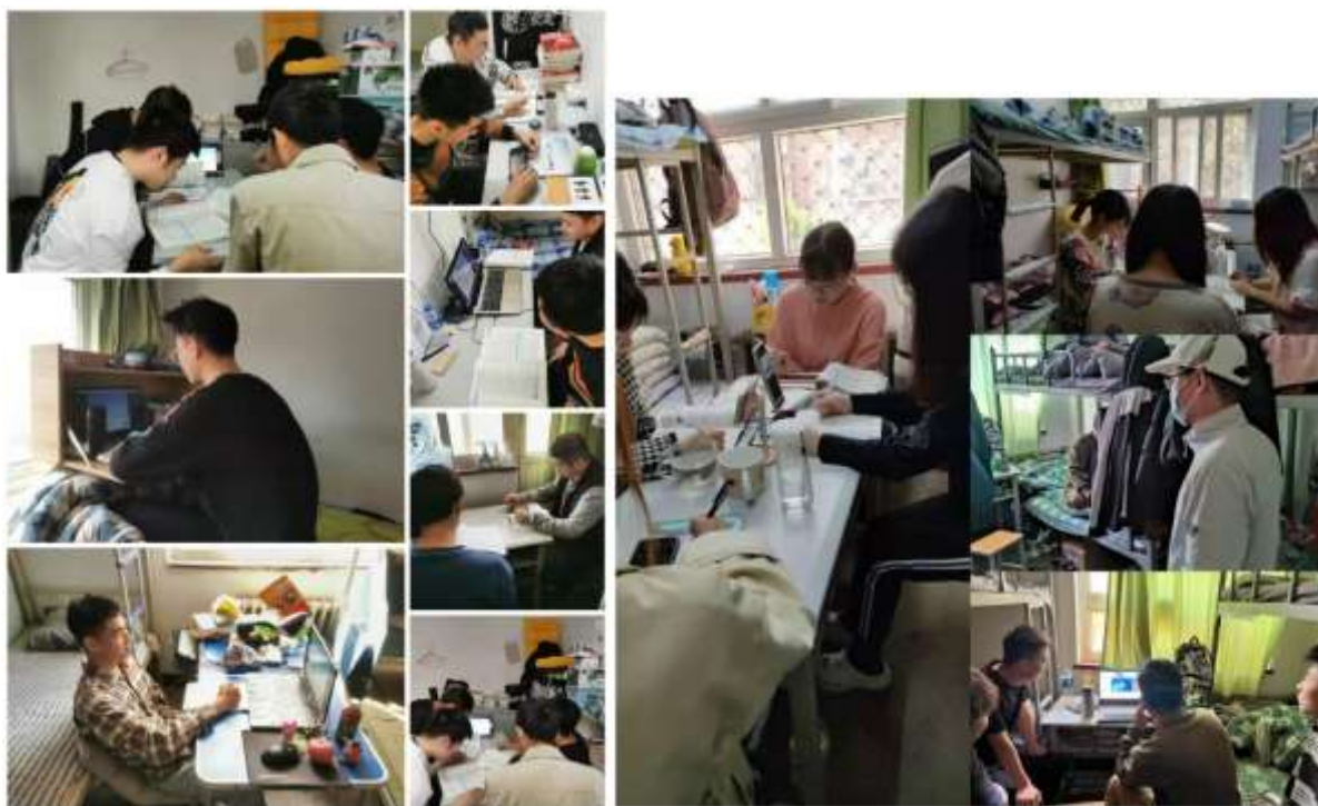
电气工程系检查学生情况

经济管理系对校内学生的检查主要由系主任、系总支书记、学生主任和辅导员老师完成，检查中发现线下课的同学出勤率为 100%。在线上上课中，学生能够按时签到。